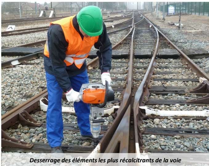
Desserrage des éléments les plus récalcitrants de la voie