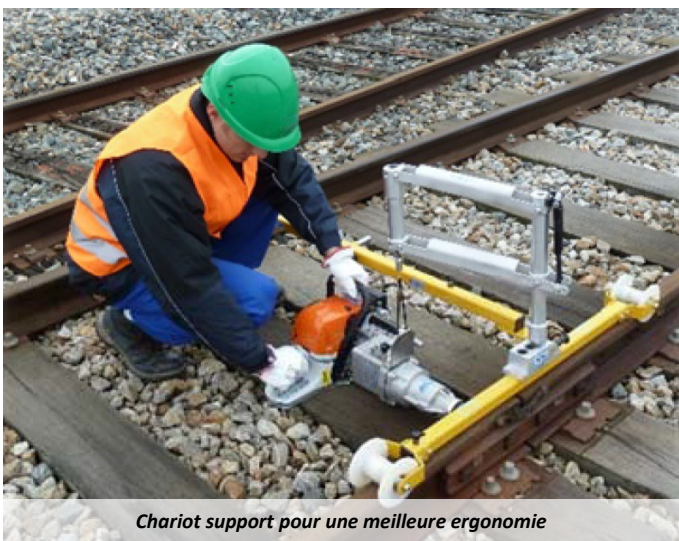
Chariot support pour une meilleure ergonomie