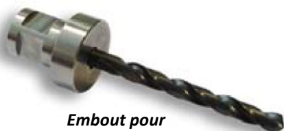
Embout pour forets hélicoïdaux