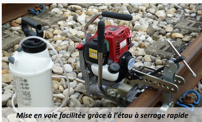
Mise en voie facilitée grâce à l'étau à serrage rapide