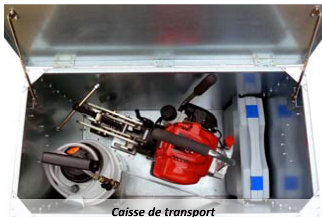
Caisse de transport